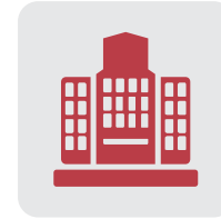
Asilos de Ancianos