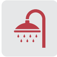
Cuartos de Duchas